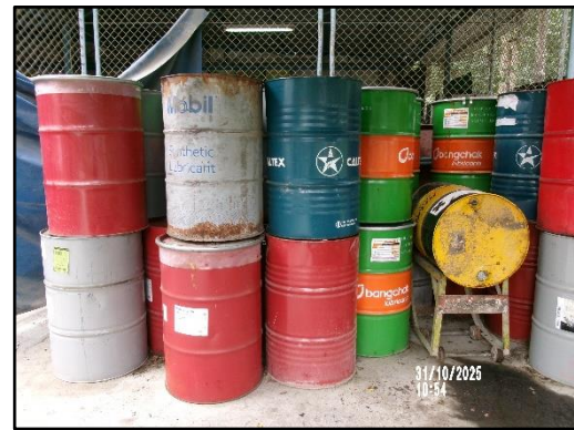
ภาพที่ 2.8 ถังสำหรับเก็บน้ำมันที่เสื่อมสภาพหรือน้ำมันหล่อลื่นที่ใช้แล้ว