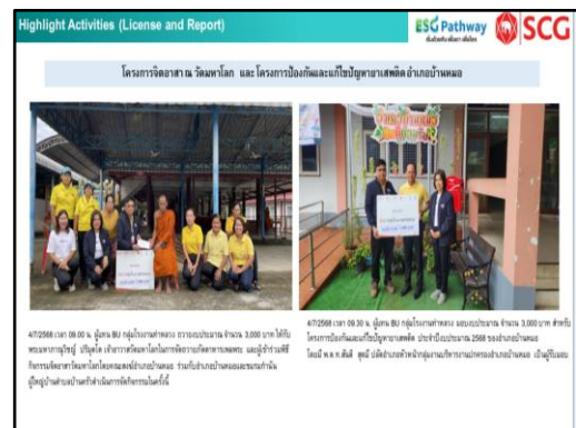
ภาพที่ 2.9 กิจกรรมชุมชนสัมพันธ์