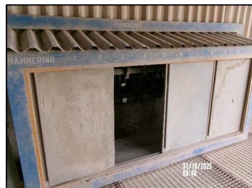
ภาพที่ 2.3 Casing หุ้มชุด Hammering Equipment ในหม้อไอ้น้ำ