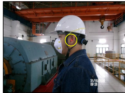
ภาพที่ 2.5 พนักงานสวมใส่อุปกรณ์ลดเสียง