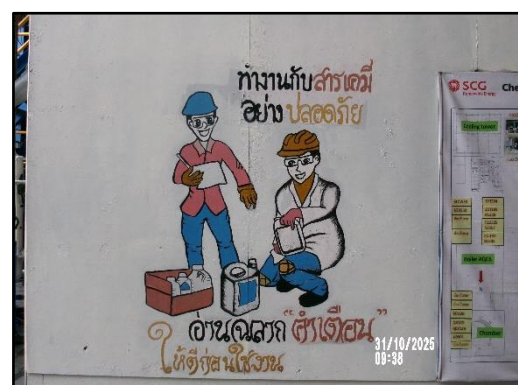
ภาพที่ 2.14 ป้ายเตือนอันตรายบริเวณต่างๆ ภายในโรงงาน