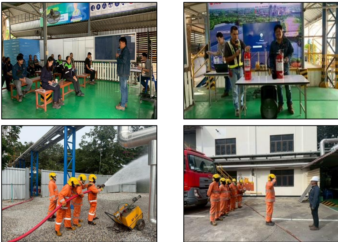
ภาพที่ 2.11 การซ้อมดับเพลิง ประจำปี 2568