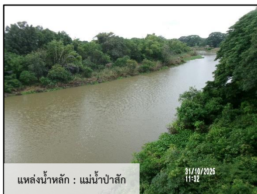
ภาพที่ 2.2 แหล่งน้ำดิบของโครงการ