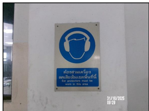
ภาพที่ 2.4 ป้ายเตือนบริเวณที่มีระดับเสียงดังเกิน 85 เดซิเบล(เอ) ภายในโครงการ เพื่อให้พนักงานสวมใส่อุปกรณ์ลดเสียง