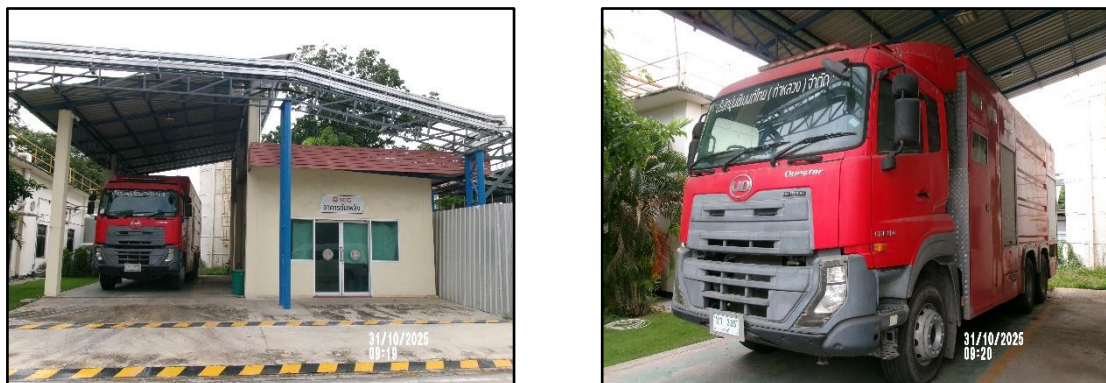
ภาพที่ 2.13 รถดับเพลิงประจำโครงการ