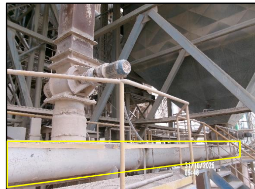
ภาพที่ 2.1 ระบบสายพานแบบปิดสำหรับลำเลียงฝุ่นจาก SP Boiler และ Precipitation Chamber