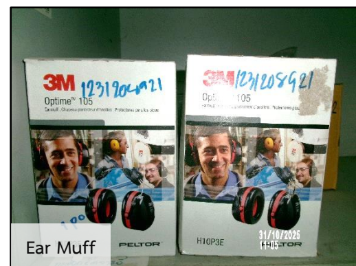
ภาพที่ 2.6 (ต่อ) อุปกรณ์ป้องกันอันตรายส่วนบุคคลสำรอง