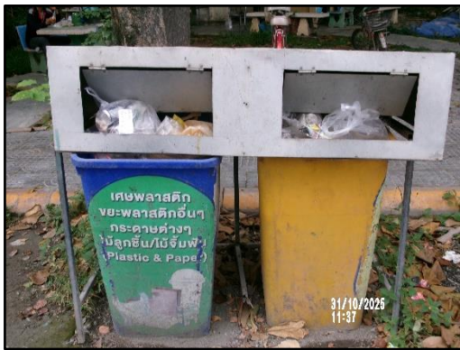
ภาพที่ 2.7 ถังขยะแยกประเภทตามจุดต่างๆ ภายในโรงงาน