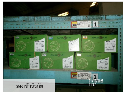
ภาพที่ 2.6 อุปกรณ์ป้องกันอันตรายส่วนบุคคลสำรอง