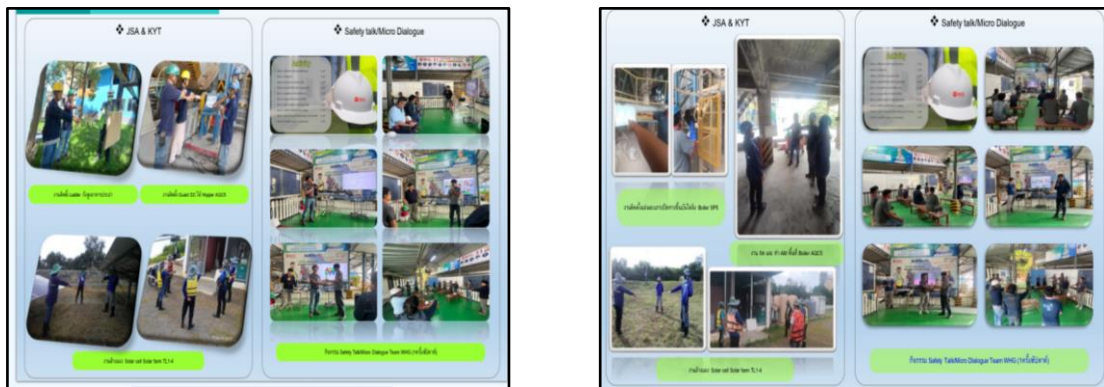
ภาพที่ 2.10 การอบรมความปลอดภัยในการทำงานในสถานที่ทำงาน