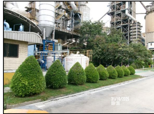
ภาพที่ 2.15 การปลูกต้นไม้บริเวณริมรั้วโรงงานและบริเวณภายในโรงงาน